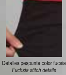
Detalles pespuntes color fucsia Fuchsia stitch details