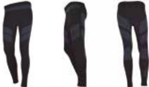
NEGRO BLACK NERO NOIR